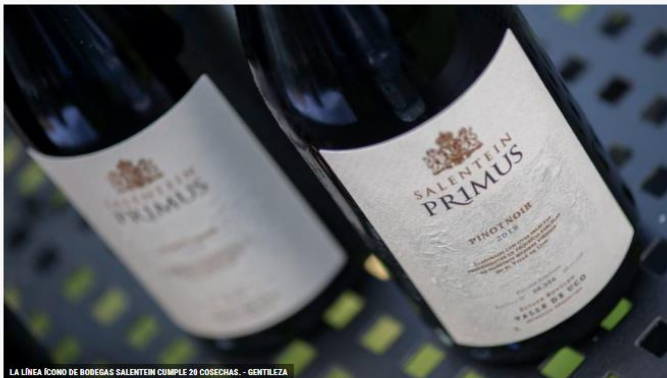
LA LÍNEA ÍCONO DE BODEGAS SALENTEIN CUMPLE 20 COSECHAS.